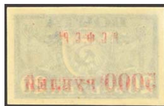
Рис. 19: м. № 22.