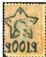
Рис. 37: № 65.