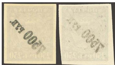
Рис. 22: м. № 24.