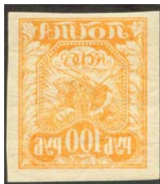
Рис. 7: м. № 8.

Во второй части первого стандартного выпуска абклячи появляются на марках всех номиналов, как на простой, так и на тонкой бумаге (рис. 7 – 13), за исключением м. № 11А 300 р. На марке номиналом 1000 р. абклячи имеются также на всех типах простых бумаг № 13 и 13А, использованных для печати этих марок (рис. 14 и 15), а также на мелованной № 13Б и хлопчатой № 13В.