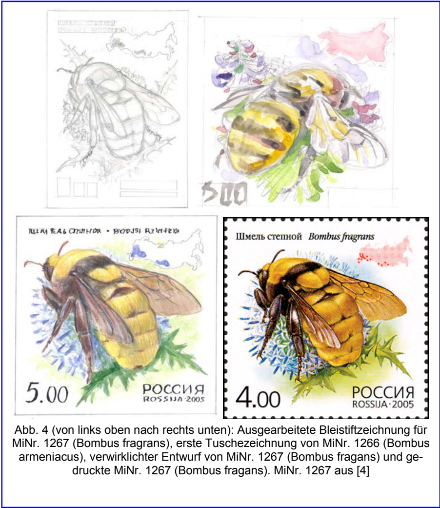
Abb. 4 (von links oben nach rechts unten): Ausgearbeitete Bleistiftzeichnung für MiNr. 1267 ( Bombus fragrans ), erste Tuschezeichnung von MiNr. 1266 ( Bombus armeniacus ), verwirklichter Entwurf von MiNr. 1267 ( Bombus fragrans ) und gedruckte MiNr. 1267 ( Bombus fragrans ). MiNr. 1267 aus [4]