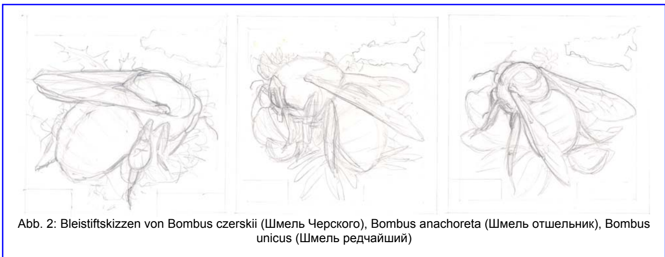
Abb. 2: Bleistiftskizzen von Bombus czerskii (Шмель Черского), Bombus anachoreta (Шмель отшельник), Bombus unicus (Шмель редчайший)