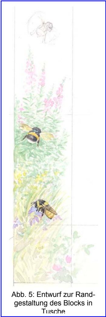
Abb. 5: Entwurf zur Randgestaltung des Blocks in Tusche